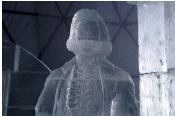
Ve speciálně klimatizované stavbě, ve které se musí neustále udržovat mínusové teploty, se budou až do jara konat komorní koncerty

Ve speciálně klimatizované stavbě, ve které se musí neustále udržovat mínusové teploty, se budou až do jara konat komorní koncerty. Vloni navštívilo tatranský dům na Hrebienku více než 150 tisíc lidí. Museli však dodržet jedno zásadní pravidlo – nedotýkat se soch. Jinak by ledová krása roztála.