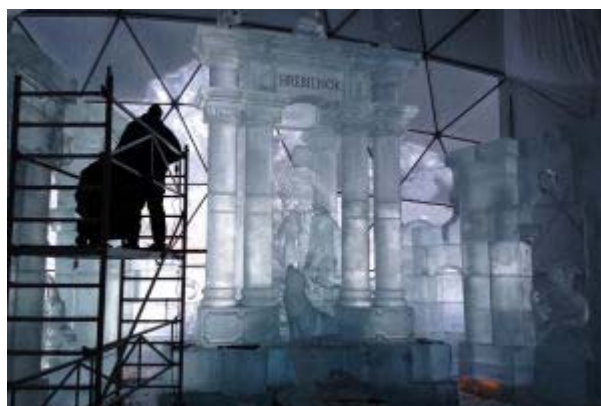
Sochaři používají pily, brusky, speciální nástavce na led i obyčejná ostrá tesařská dláta.